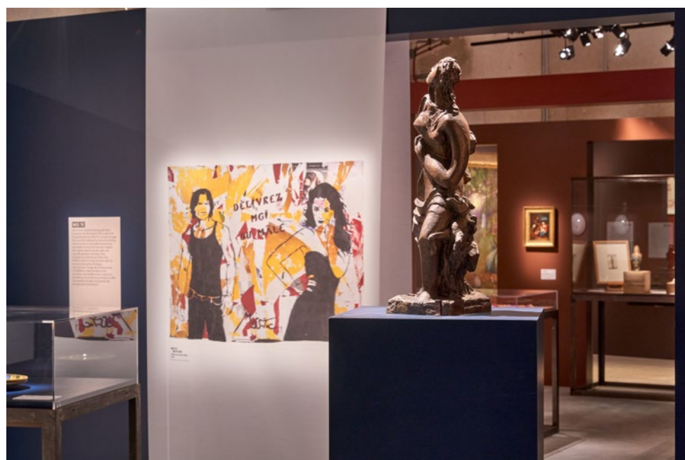
Vue de l'exposition La femme , un regard différent présentée au Centre pénitentiaire de Réau en 2019.

Dans le cadre de sa politique d'élargissement des publics, Paris Musées tisse des liens privilégiés avec les acteurs de l'insertion, de la prévention, de la politique de la ville, de l'alphabétisation, de l'éducation, de l'animation ou de la santé afin de favoriser l'accès des musées aux publics les plus vulnérables et développer des actions artistiques et culturelles adaptées. Paris Musées anime 15 conventions de partenariat avec des acteurs majeurs de l'action sociale et de la santé à Paris et en Île-de-France. Ces rencontres débouchent sur la mise en place de projets à long terme et engagent les musées dans des partenariats privilégiés, construits sur mesure avec les structures sociales : parcours de visites et ateliers thématiques pouvant être en lien avec les problématiques sociales, projets participatifs et de création partagée, interventions « Hors les murs » des médiateurs culturels dans les structures, expositions itinérantes, etc.